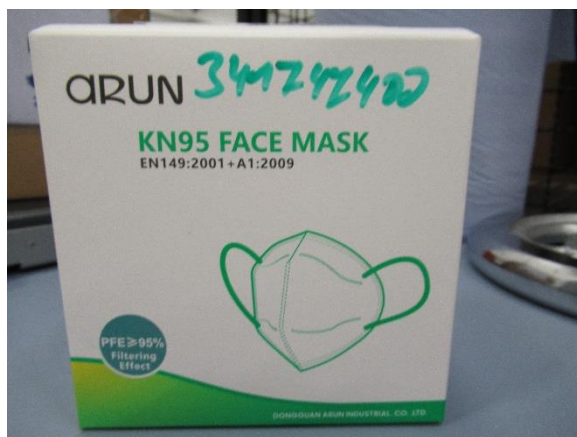
Umverpackung front / Outer packaging front

Die folgende Maske wurde geprüft / The following mask was tested: