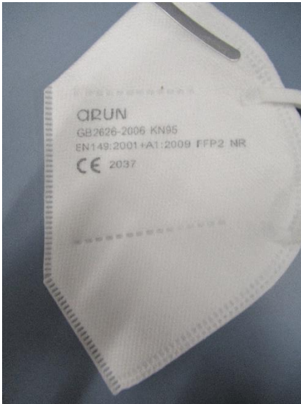
Seitenansicht links / side view left