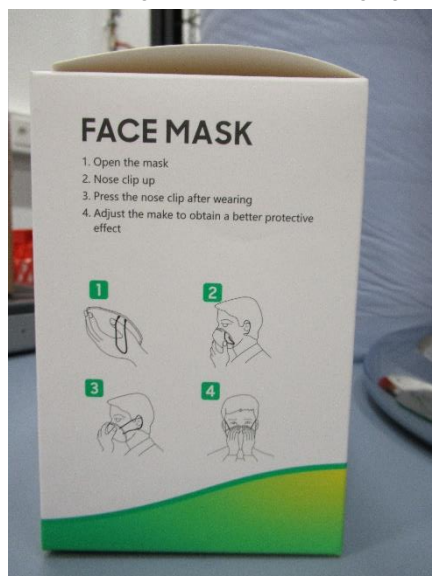
Umverpackung Seite 1 / outer packaging side 1