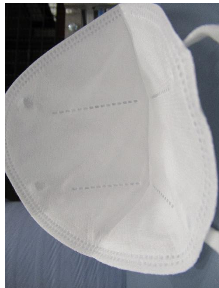
Innenansicht / inner view