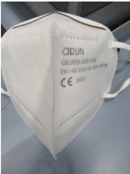
Frontansicht / front view