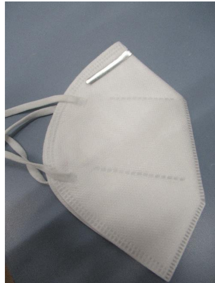
Seitenansicht rechts / side view right