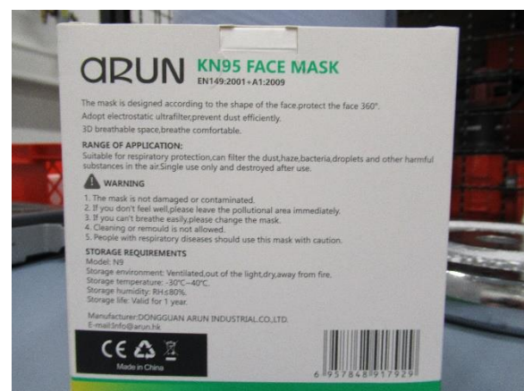
Umverpackung Rückseite / outer packaging back