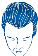
Grad 1: Geheimratsecken

Die folgende, vereinfachte Darstellung auf Basis der sogenannten „Hamilton-Skala“ verdeutlicht, wo Haarverlust beginnt und wie er fortschreitet.