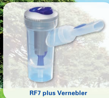
RF7 plus Vernebler