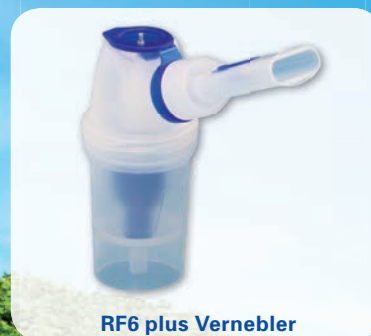
RF6 plus Vernebler