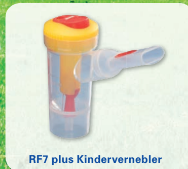
RF7 plus Kindervernebler