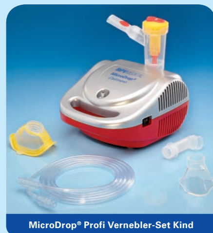
MicroDrop® Profi Vernebler-Set Kind

Inhalt: Vernebler RF7 plus, Mundstück mit Ausatemventil, Druckluftschlauch, Schlauchtülle, inkl. Soft-Kinder- (M 50020-44000) und Soft-Erwachsenenmaske (M 50020-44100) in blau.