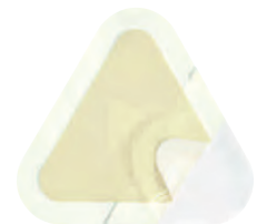
Askina® Transorbent® Sacrum