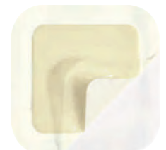
Askina® Transorbent® Border