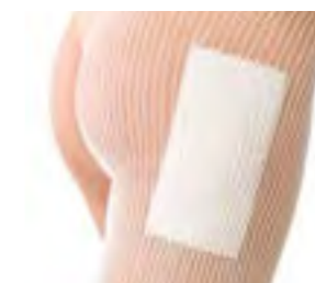
Elastofix® Netzschlauch fixiert sicher und passt sich der Körperoberfläche gut an, ohne Stauungen und Abschnürungen zu verursachen.