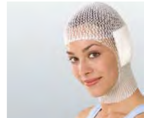
Einfache und schnelle Applikation.

Elastofix® besteht aus 55 % Baumwolle, 25 % Elastodien und 20 % Polyamid.