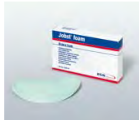
Für die gleichmäßige Kompression.