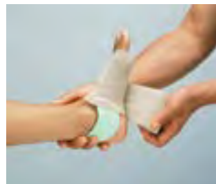
JOBST® foam passt sich jeder Körperkontur an.

JOBST® foam besteht aus synthetischem Latex.