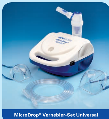
MicroDrop® Vernebler-Set Universal

Sowohl mit den MicroDrop® Kompressoren, als auch mit anderen Kompressoren und mit Druckluftflowmetern: