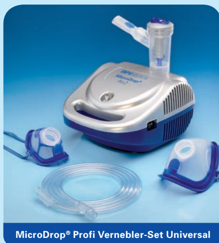
MicroDrop® Profi Vernebler-Set Universal

Inhalt: Vernebler RF6 plus, Mundstück mit Ausatemventil, Druckluftschlauch, Schlauchtülle, inkl. Kinder- (M 50020-42600) und Erwachsenenmaske (M 50020-42500).