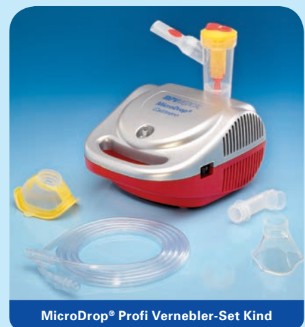
MicroDrop® Profi Vernebler-Set Kind

Inhalt: Vernebler RF7 plus, Mundstück mit Ausatemventil, Druckluftschlauch, Schlauchtülle, inkl. Soft-Kinder- (M 50020-44000) und Soft-Erwachsenenmaske (M 50020-44100) in blau.