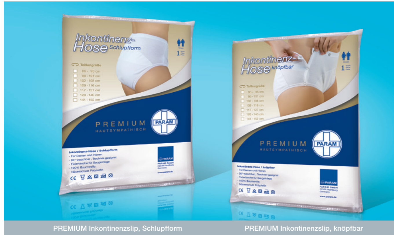
PREMIUM Inkontinenzslip, Schlupfform