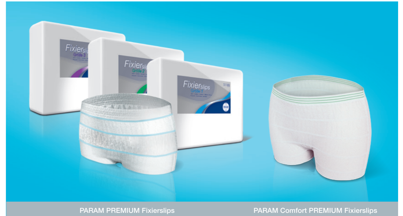
PARAM PREMIUM Fixierslips