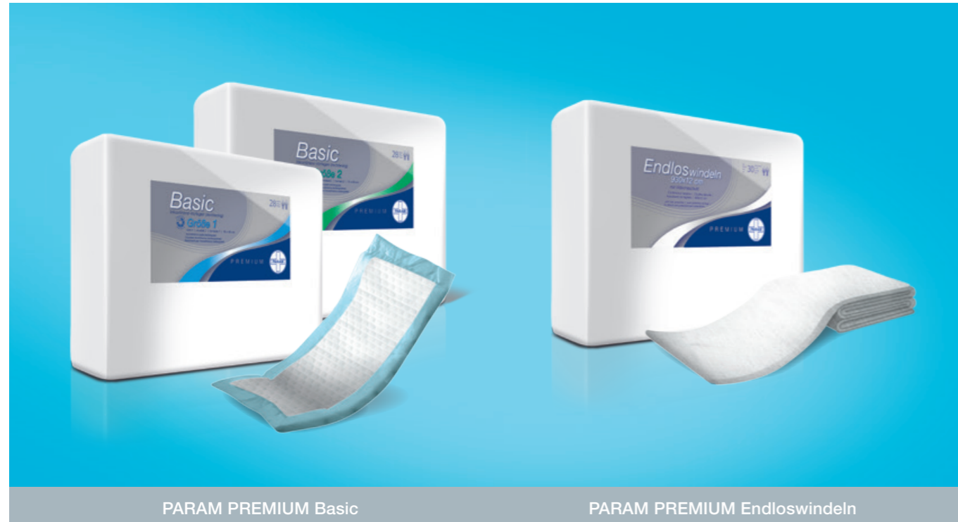
PARAM PREMIUM Basic