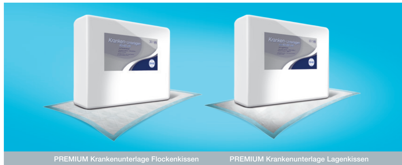
PREMIUM Krankenunterlage Flockenkissen