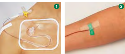
1 Curagard® 2 Suprasorb® F