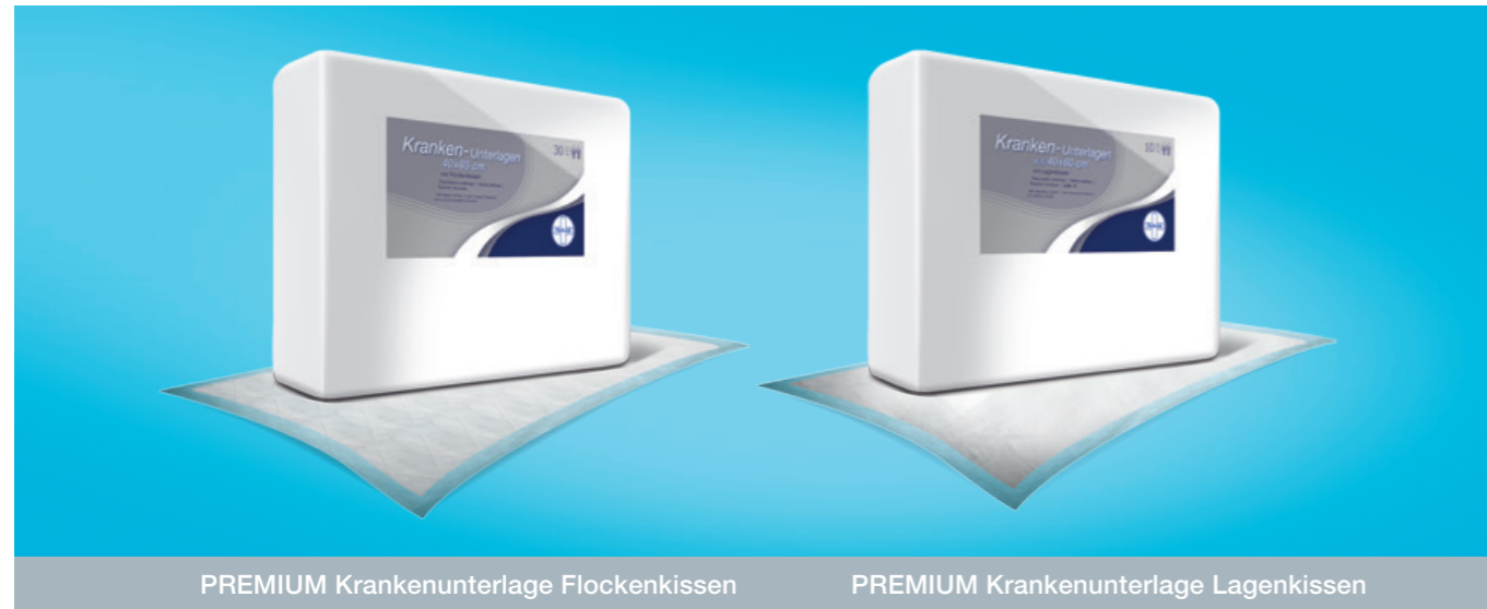
PREMIUM Krankenunterlage Flockenkissen