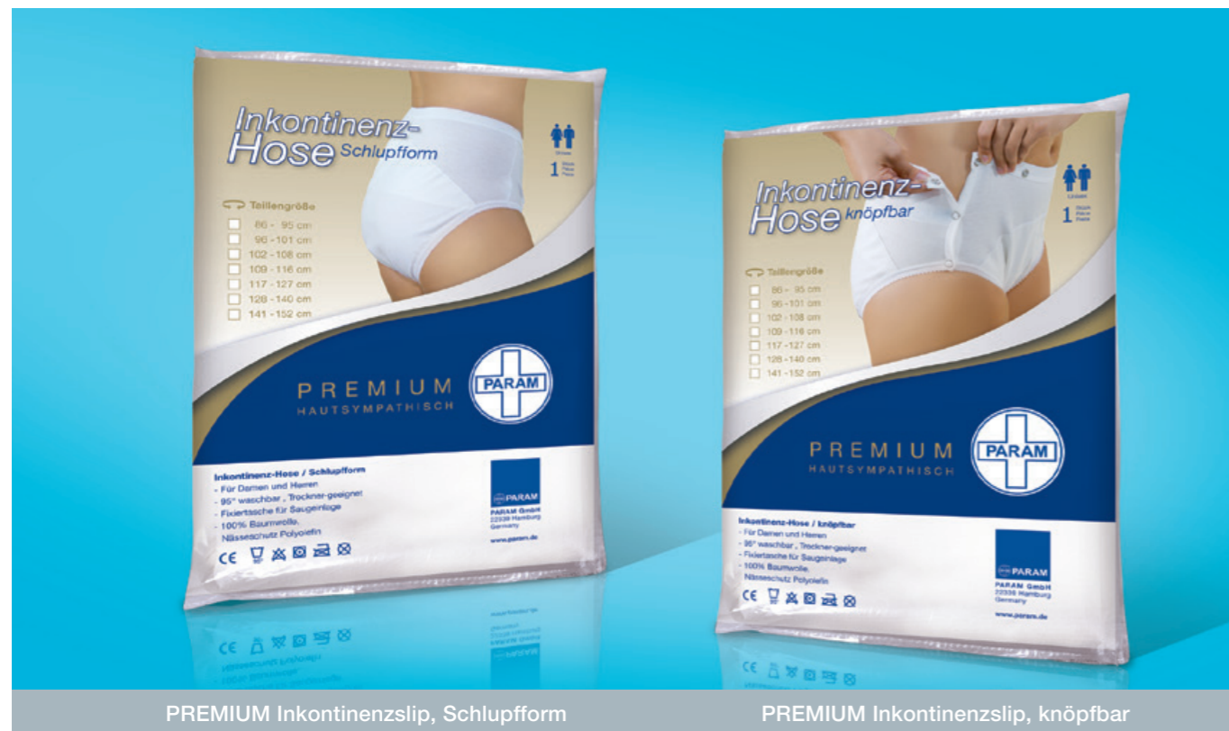
PREMIUM Inkontinenzslip, Schlupfform