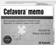
Rhodiola + Aktivnährstoffe