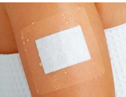
Curapor® transparenter Wundverband steril