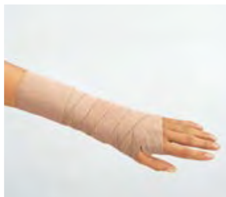
Für Stütz- und Entlastungsverbände.