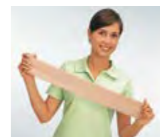
Eloflex® eignet sich hervorragend für Stützverbände bei Tendovaginitis.

Eloflex® besteht aus 57 % Baumwolle, 33 % Viskose, 8 % Polyamid und 2 % Elastan.