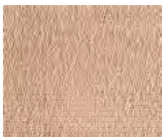
Die spezielle Gewebestruktur garantiert eine hohe Luftdurchlässigkeit von Elodur® forte.

Elodur® forte besteht zu 94 % aus Baumwolle und zu 6 % aus Elastan.