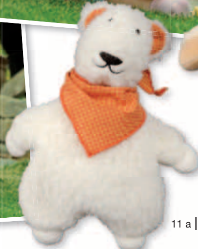
11 a |