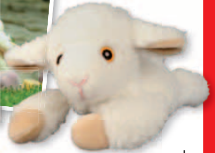
11 b |