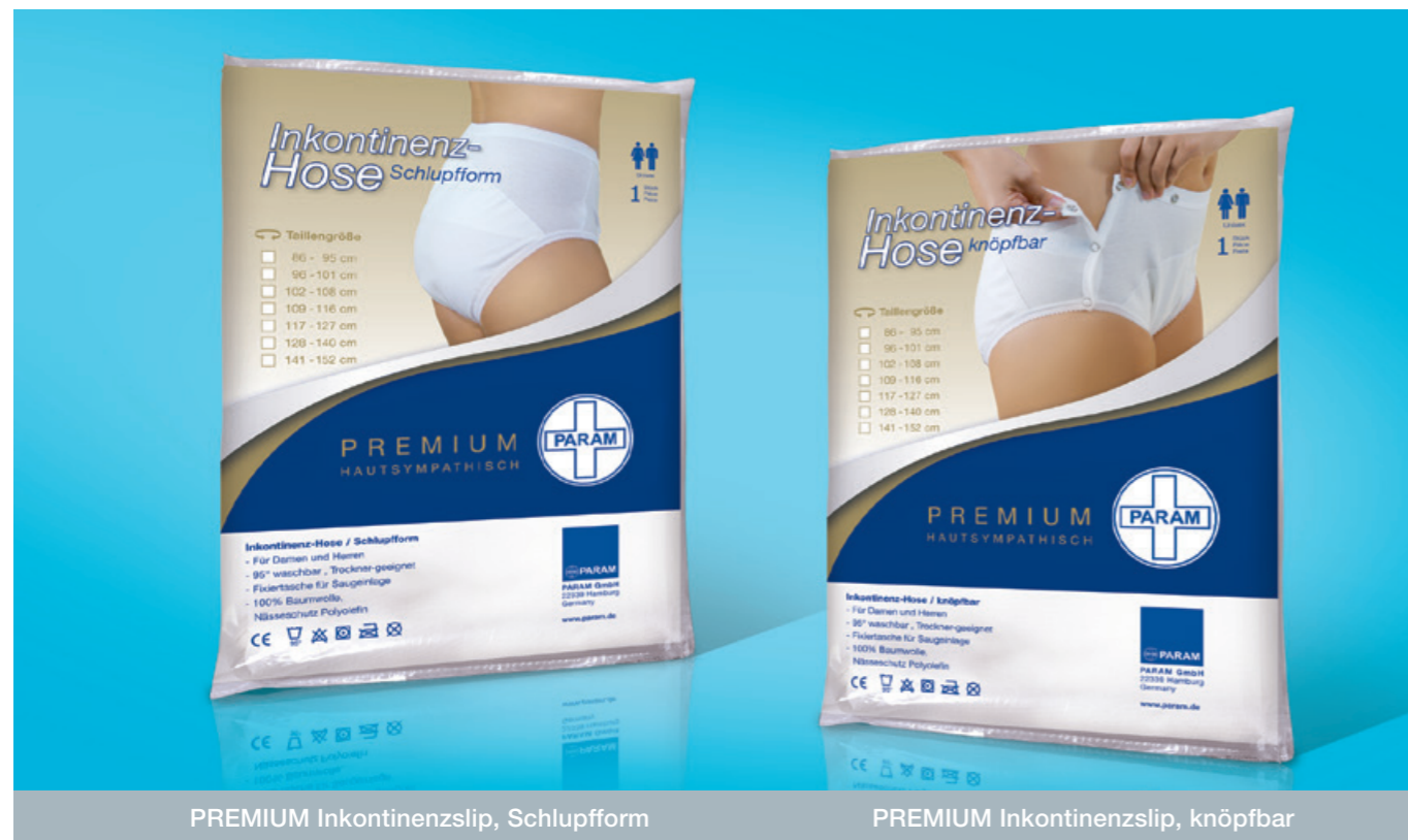
PREMIUM Inkontinenzslip, Schlupfform