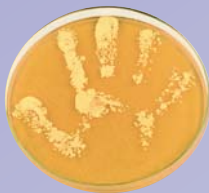
Handabklatsch ohne Seifenwaschung oder Desinfektion

Mit ihrer „Clean Care is Safer Care“-Initiative startete die WHO 2005 eine weltweite Kampagne für mehr Patientensicherheit. Im Mittelpunkt steht die Verbesserung der Händedesinfektion, da diese einen direkten Einfluss auf die Übertragung pathogener Erreger hat. Für dieses Ziel wurde das Konzept der „5 Momente der Händedesinfektion“ entwickelt (1).